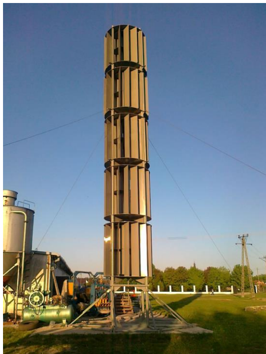
Ryc. 4. Siłownia wiatrowa o pionowej osi obrotu – przykład.