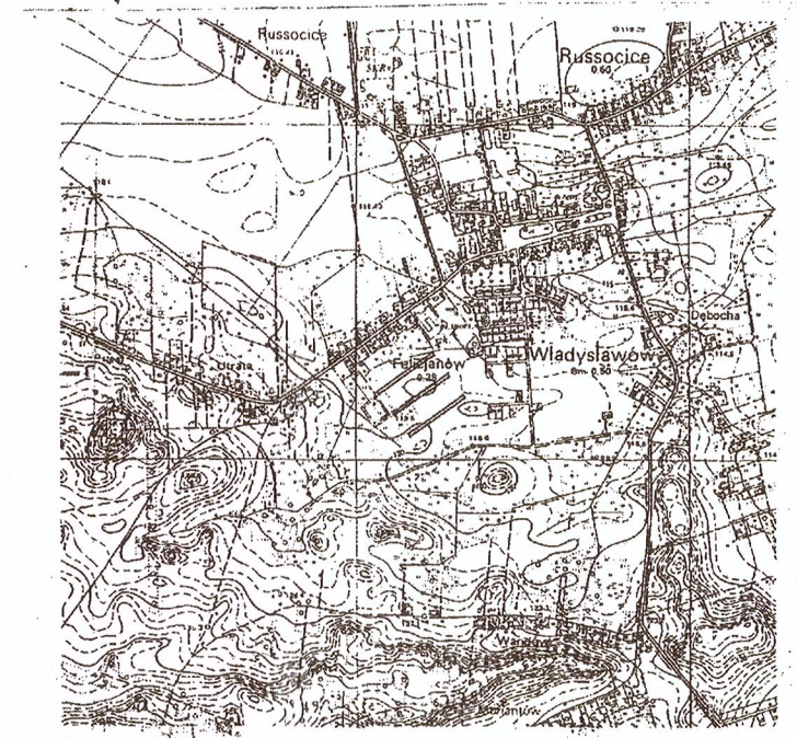
Orientacja 1: 25 000

GEO-INWEST Żuki 2b, 62-700 Turek tel. 509-801-859 NIP 6681838999 REGON 301084610 mgr inż. Michał Radka geodeta uprawniony świadectwo nr 20562