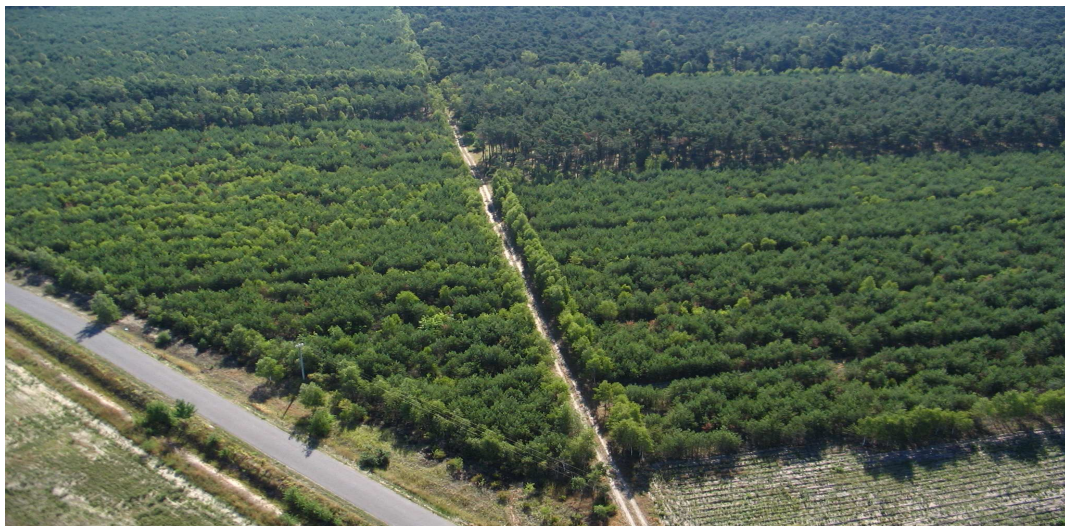
Tabela 3.1.2.1. Lesistość obszaru Tureckiej Unii Rozwoju

Dominującą formą są zwarte kompleksy leśne. Przeważają: bór świeży i bór mieszany. W drzewostanie dominuje sosna, brzoza i lokalnie świerk.